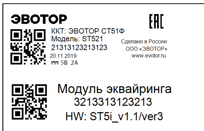
Рисунок 3. Пример маркировочного шильда