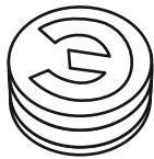
Рисунок 1. Изображение пломбы